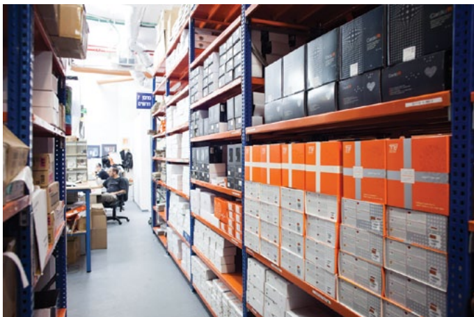
מחסן מכשור רפואי

"התמיכה התפעולית בפעילות חברת שחל היא מאתגרת מאוד. זאת, מכיוון שהחברה מפתחת בעצמה את מרבית מוצריה, מייצרת אותם, מבצעת את פעילויות ההרכבה והאינטגרציה, ומספקת אותם ללקוחות הסופיים - הן בארץ והן בחו"ל". כך אומר רמי ברוך, מנהל הרכש והלוגיסטיקה בחברת שחל, והוא מוסיף: "התמיכה כוללת את כל חוליות שרשרת האספקה, וכל זאת באיכות גבוהה, בזמני תגובה מהירים ביותר, ובעלות כוללת מיטבית".