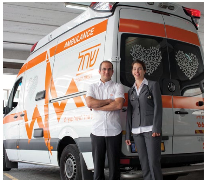
צוות רפואי בניידת טיפול נמרץ

נוסף לעיל, התמיכה התפעולית כוללת רכישת מרכבי רכב והרכבת ניידות לטיפול נמרץ. וכן, טיפול בצידוד ובמכשור הרפואיים, הנמצאים בניידות, ובכלל זה: צידוד החייאה, צידוד לטיפול נמרץ, מכשור רפואי, ועוד.